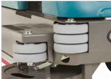
Zwaar frame met beschermende hoekrollers

Beschermkap beschermt gebruikers tegen vallende voorwerpen.