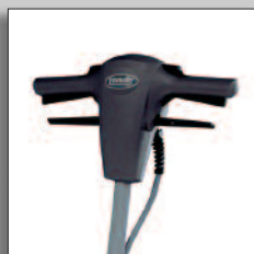
Ergonomisch ontworpen & comfortabel in gebruik