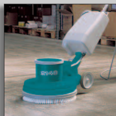
Optional solution tank