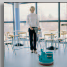
Machine in actie